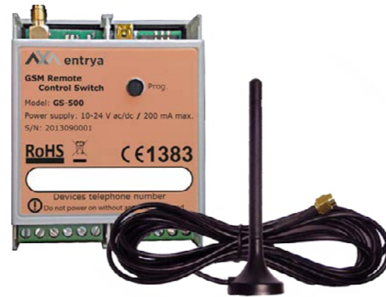
GSM module en antenne

Alle oproepen naar uw GS-500 zijn gratis want de module weigert alle oproepen. U kunt het toestel laten terugbellen om een actie te bevestigen. Gaat u veelvuldig gebruik maken van deze controlefunctie, dan raden wij aan om voor een abonnement te kiezen.