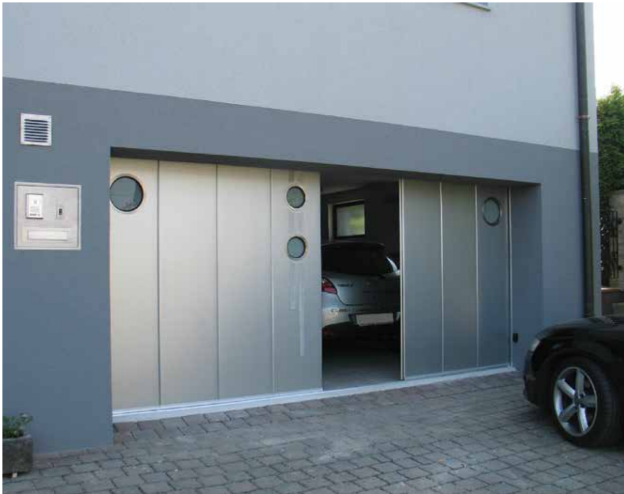
Zijwaartse Sectional Garagedeur